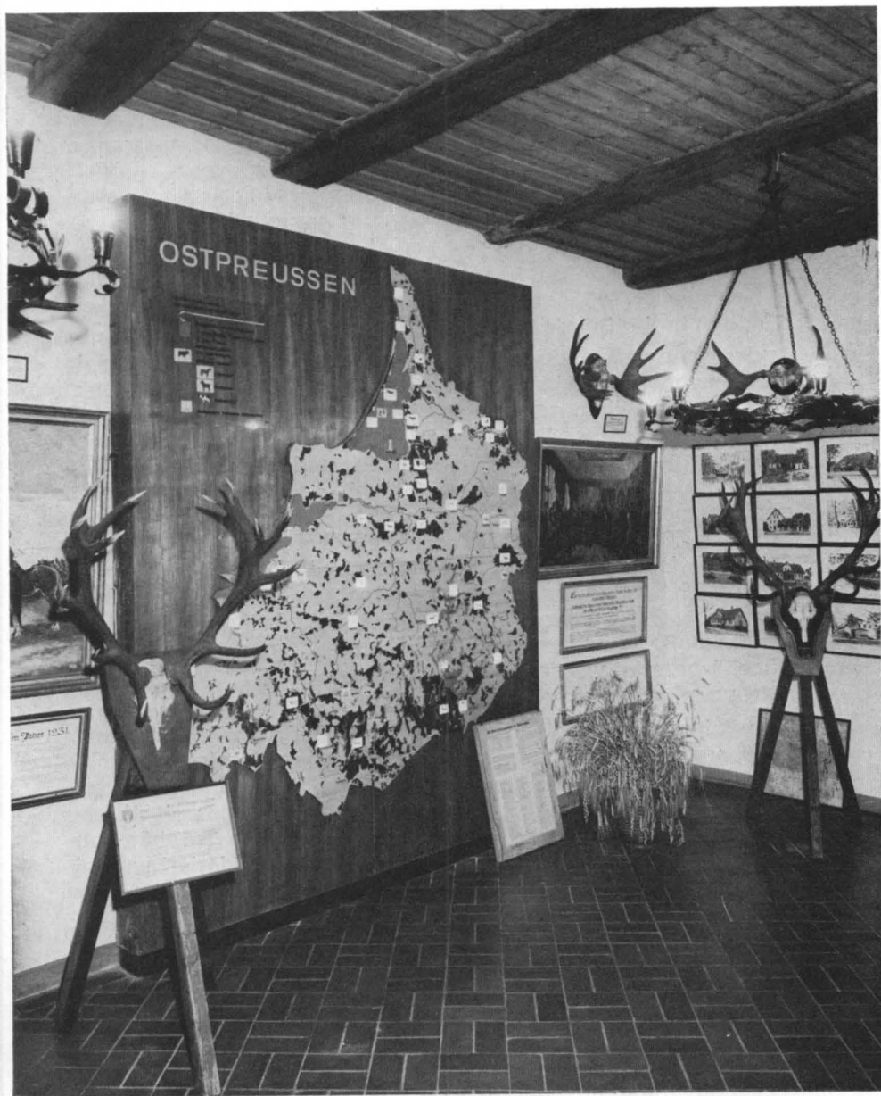
Ostpreußisches Jagdmuseum in Lüneburg