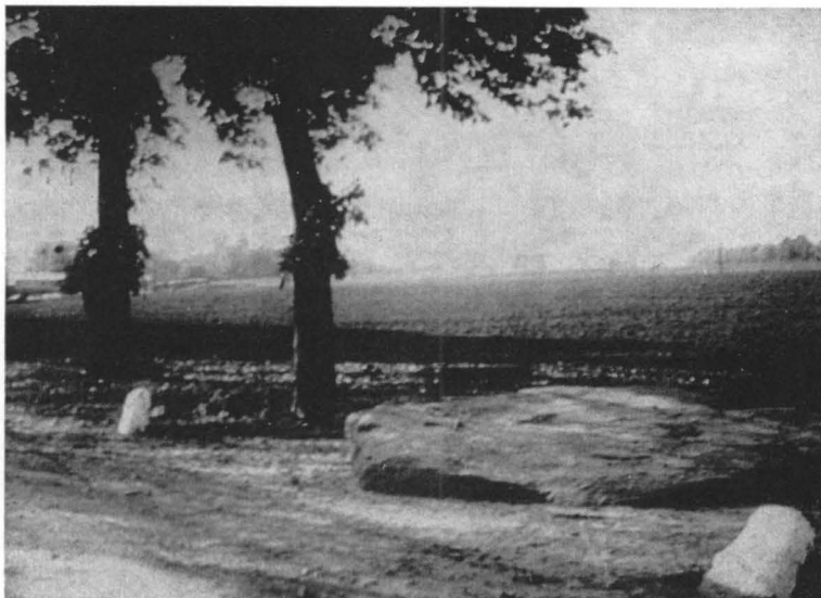
Der „breite“ Stein