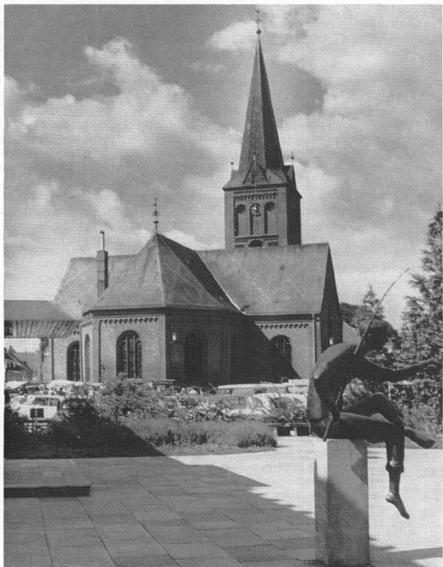
Plön, ein Kreis mit Seen und Wäldern, der seine Schönheit bei jeder Stimmung der Natur offenbart. Hier ein Blick auf die Nikolaikirche in Plön, im Vordergrund, vor dem Gebäude der Kreissparkasse, die Plastik des Anglers.